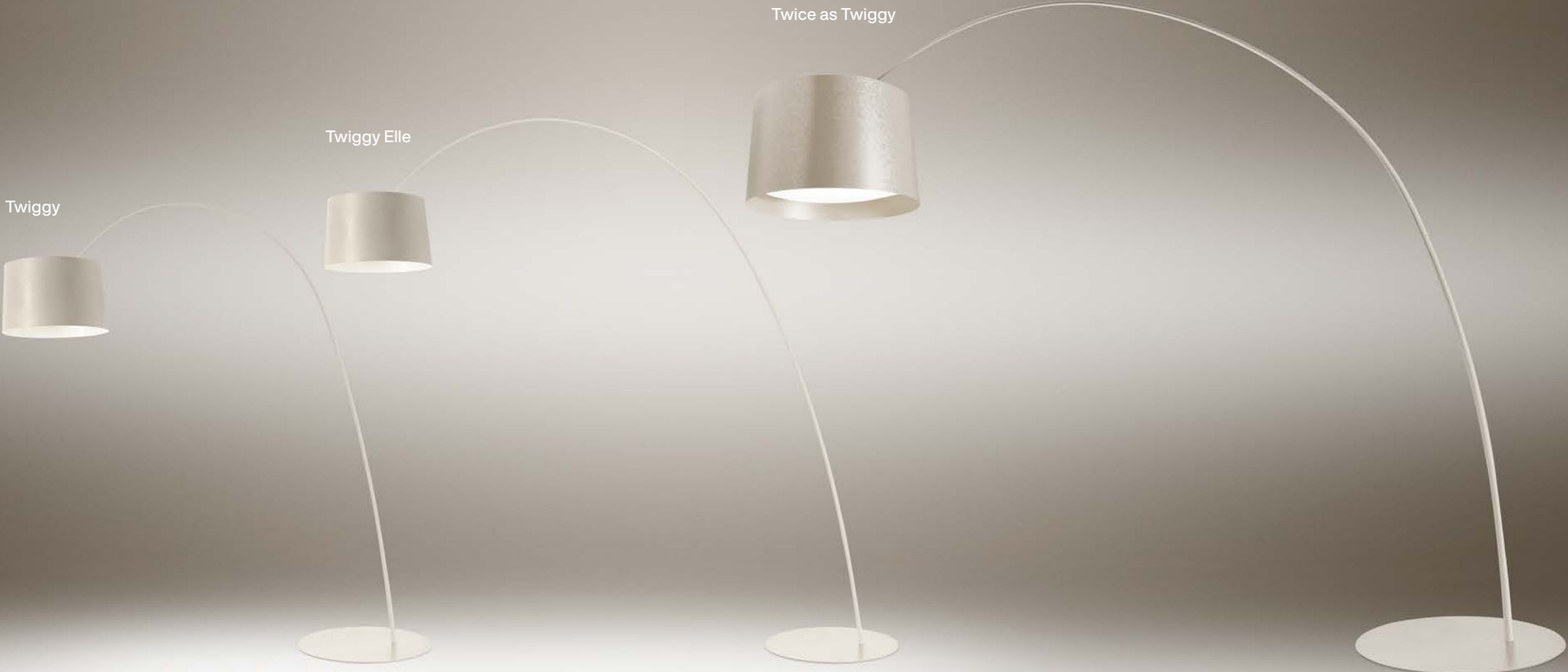
Twice as Twiggy