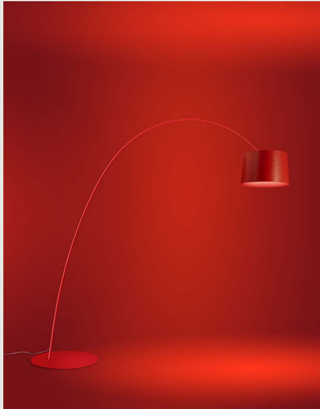
Foscarini – Twiggy Elle